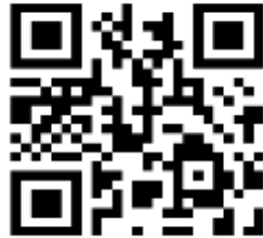
Figura 04 – Documentário: O significado de pertencimento para mulheres que escutam com os olhos e falam com as mãos