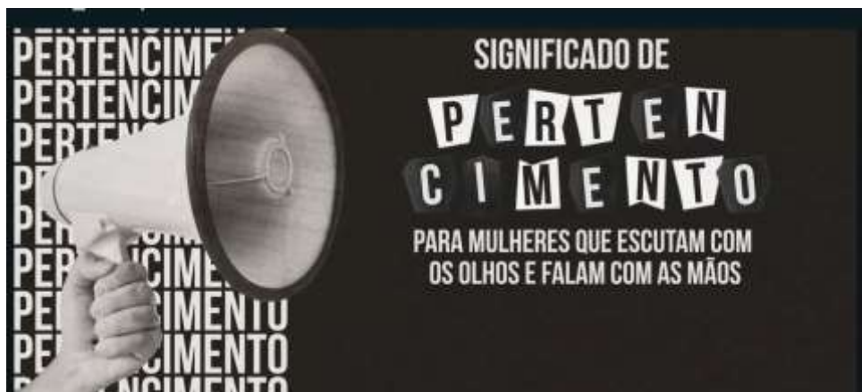
Figura 02- Vinheta documentário