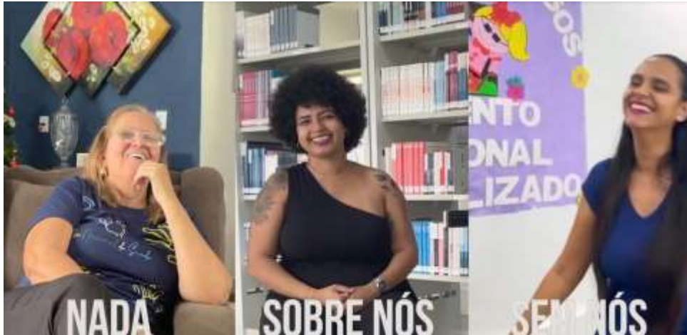
Figura 03 – Lema: Nada sobre nós sem nós