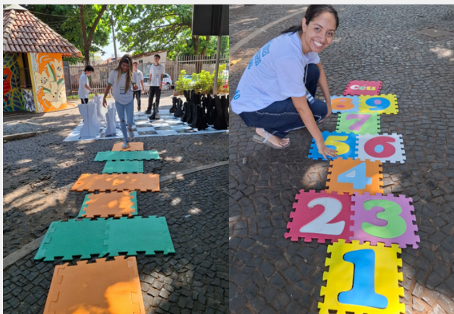
Figura 11 - Jogo Amarelinha