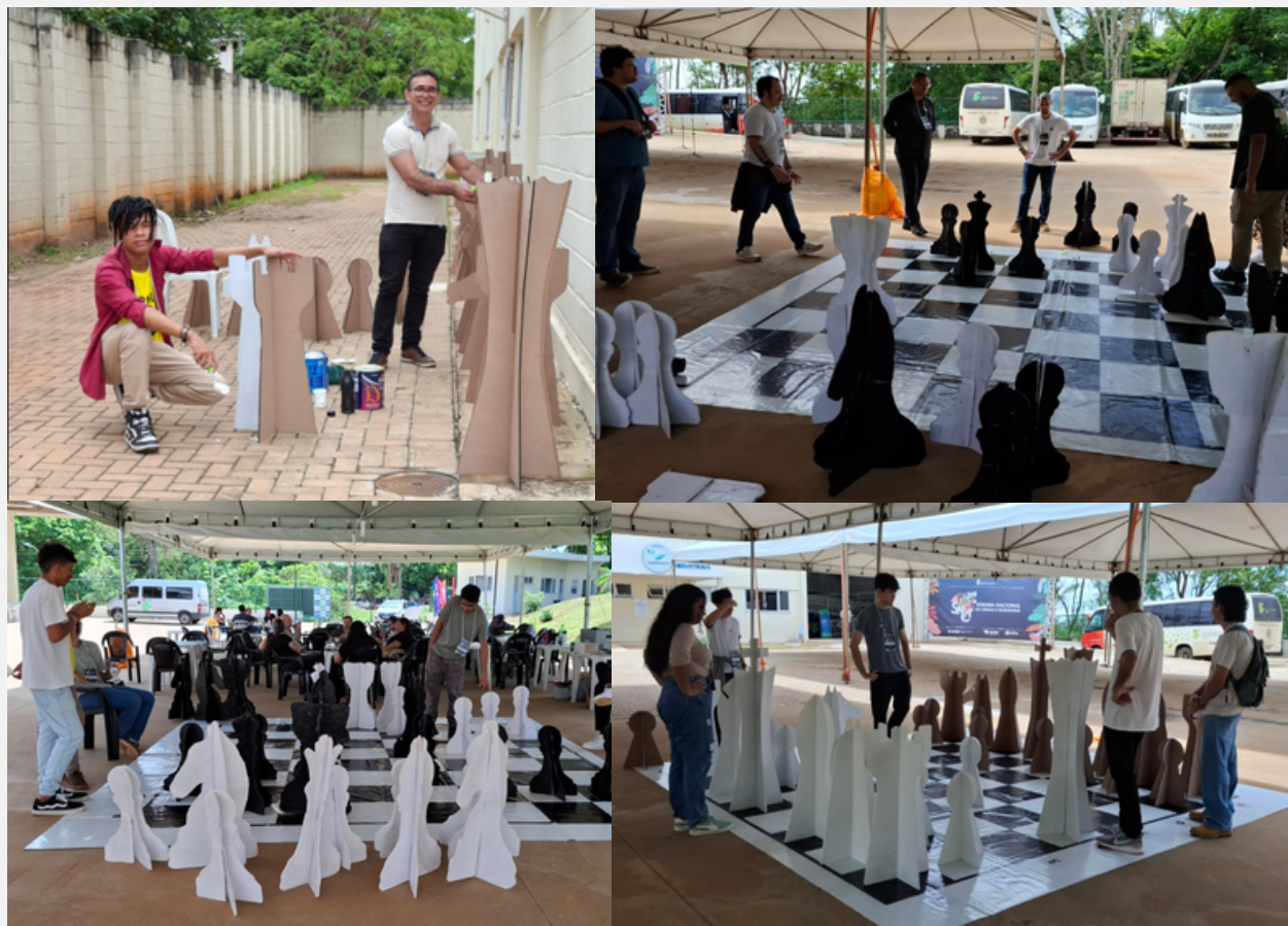
Figura 3 - Xadrez Gigante