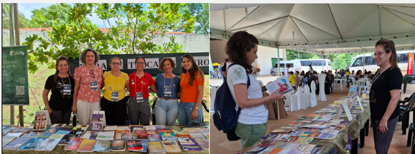
Figura 2 - Feira de Troca de Livros