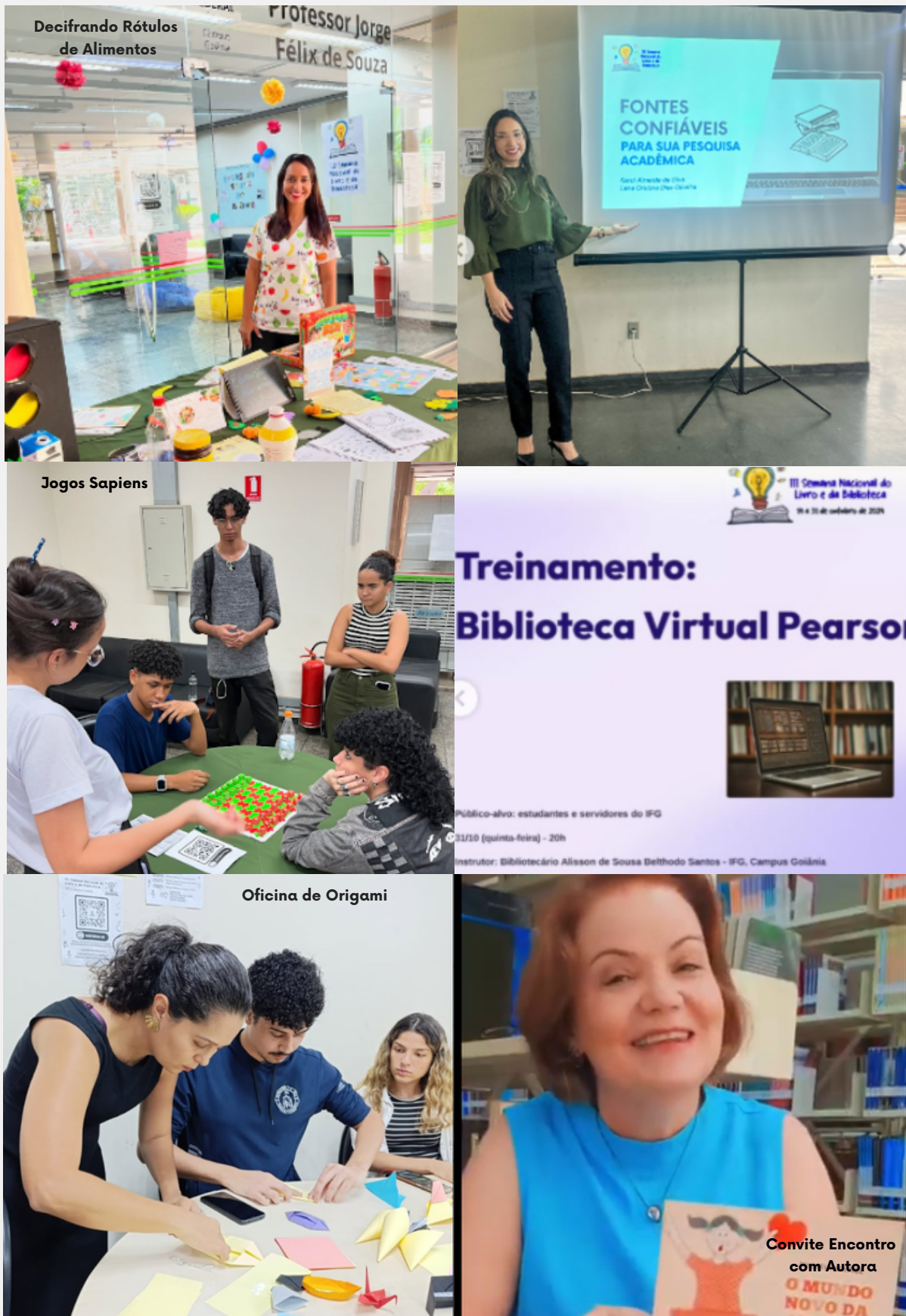
Fonte: Biblioteca Professor Jorge Félix de Souza - Câmpus Goiânia